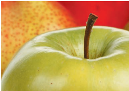
350 dpi, Photoshop-Datei

Um Qualitätsverluste zu vermeiden, sollten Ihre Daten mit mind. 350 dpi bei Originalgröße angelegt sein. Das Interpolieren („Hochrechnen“) von Bildern sollte vermieden werden, da es nur in den wenigsten Fällen zu besseren Ergebnissen bei der Ausgabe Ihrer Druckdaten führt.