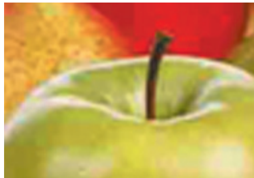
72 dpi, Jpeg-komprimiert